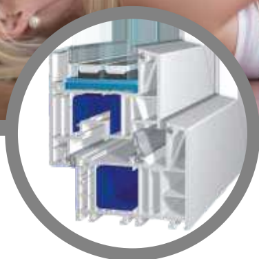
bluEvolution: 82 MD