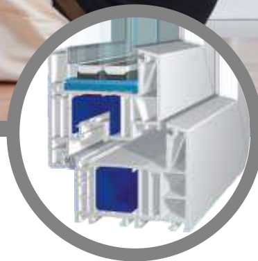
bluEvolution: 82 AD